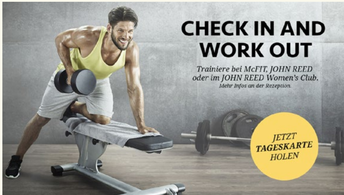
Abb.: Motiv für Poster, Screens, Beileger und Flyer

Gerne stehen wir Ihnen bei der Bewerbung Ihres neuen Angebotes zur Seite. Dabei unterstützen wir Sie mit einem umfassenden Marketing-Paket, das neben Flyern und Postern verschiedene Give Aways umfassen kann.